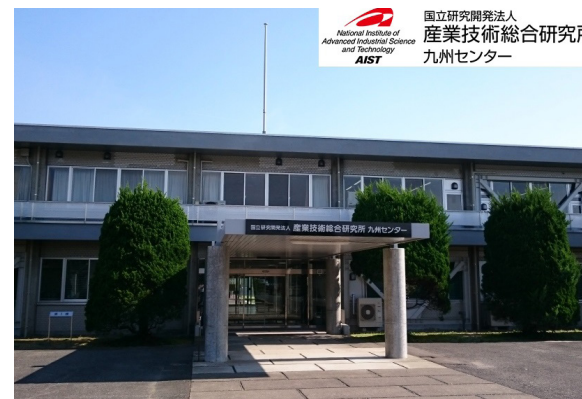
産業技術総合研究所 九州センター

研究拠点としては、高度なセンシング技術による様々な製造現場の課題解決、太陽電池モジュールの長期信頼性評価に関する研究等を行っています。また連携拠点として、技術コンサルティング、共同研究・受託研究等のコーディネーション、各種セミナーやマッチング・イベント等を実施しています。