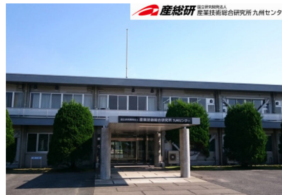
産業技術総合研究所 九州センター

技術の「橋渡し」を使命とする国内最大級の公的研究機関である産総研の、九州・沖縄地域における拠点です。当センターでは様々な製造現場の課題解決に役立つ高度なセンシング技術(スマート製造センシング技術)の研究開発に取り組んでいます。またミニマルIoTデバイス実証ラボを設置し、他の大学・公的機関と協力して、様々なデバイス等のアイデアを具現化するための試作機能を提供しています。さらに、技術コンサルティング、共同研究・受託研究等のコーディネート、各種セミナー・イベント等を通じ、全国に展開する産総研の成果の橋渡しを推進しています。